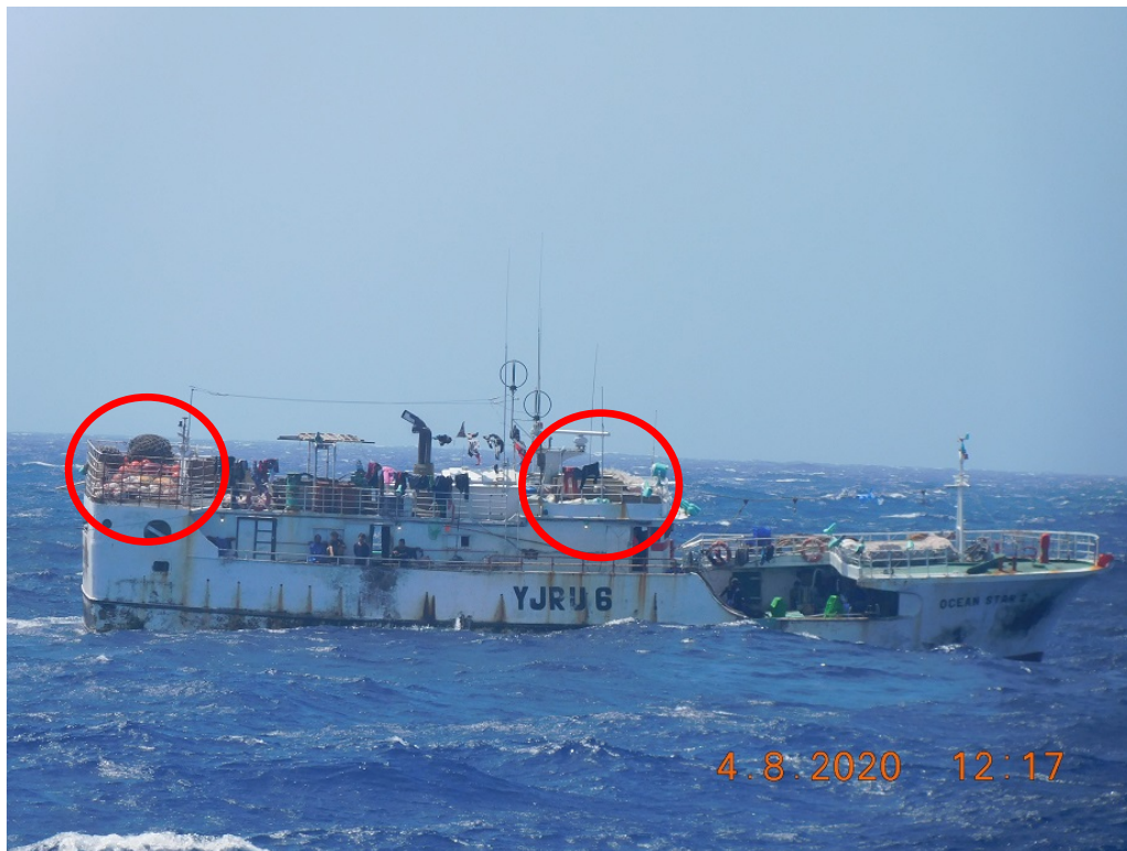
Figura (B). Fotografía de la Guardia costera de Estados Unidos del FV OCEAN STAR NO 2 durante la patrulla del 8 de abril de 2020. El círculo rojo resalta el arte de pesca de palangre observado en la cubierta del buque.