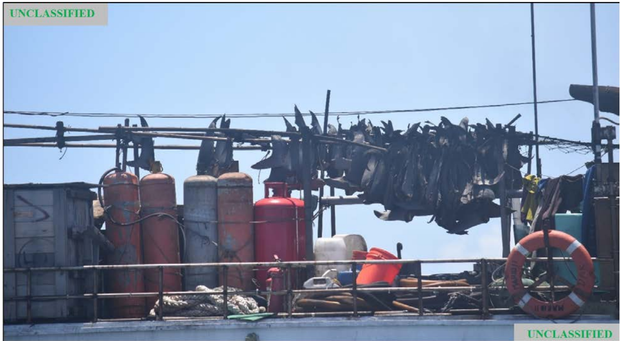
Figura (D). Fotografía tomada por la USCG del FV MARIO NO 11 durante la patrulla del 6 de mayo de 2020, que muestran un primer plano de las aletas de tiburón colgadas por encima de la cubierta.