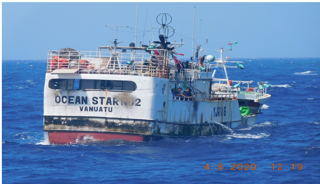
Figura (C). Fotografía de la Guardia costera de Estados del FV OCEAN STAR NO 2 durante la patrulla del 8 de abril de 2020. El círculo rojo resalta el nombre del buque y el Estado del pabellón pintado en la popa del buque.