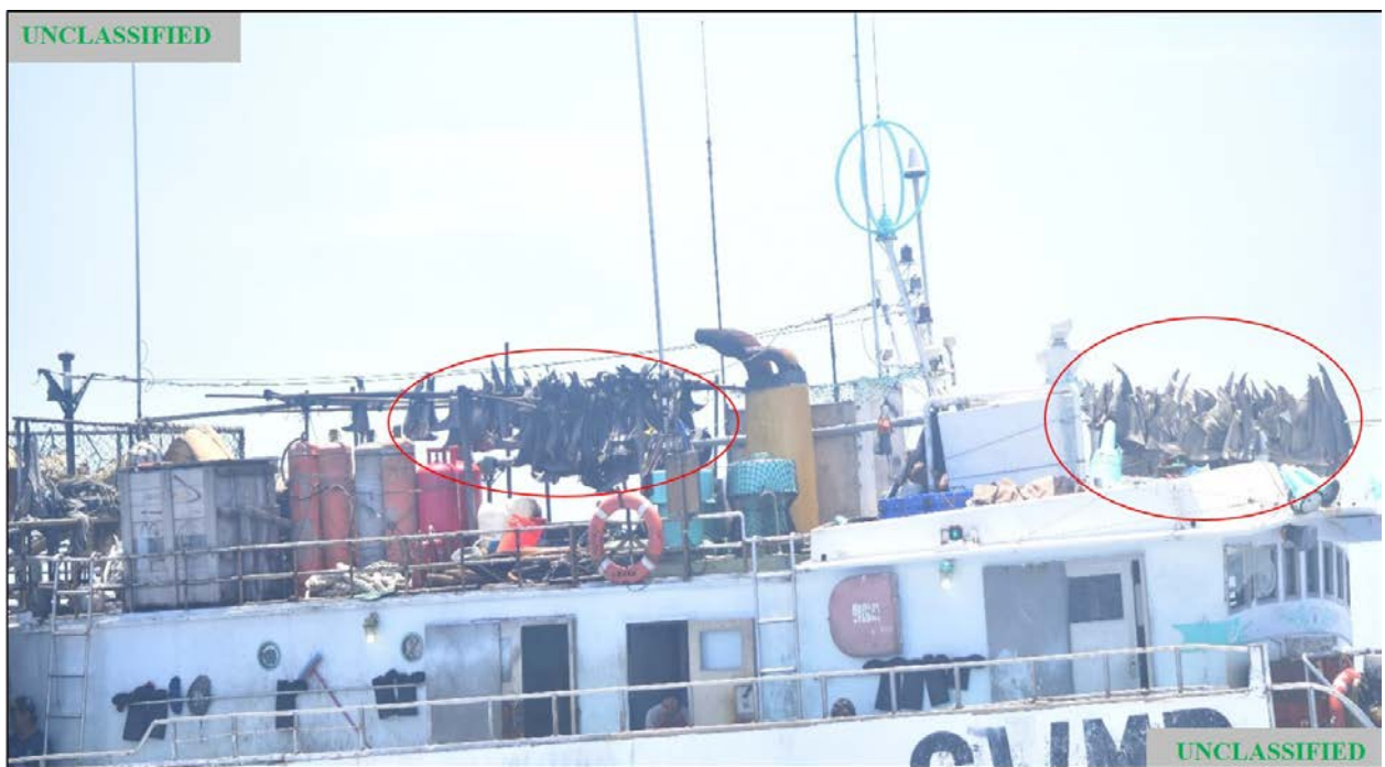
Figura (C). Fotografía tomada por la USCG del FV MARIO NO 11 durante la patrulla del 6 de mayo de 2020. El círculo rojo encuadra las aletas de tiburones que cuelgan por encima de la cubierta.