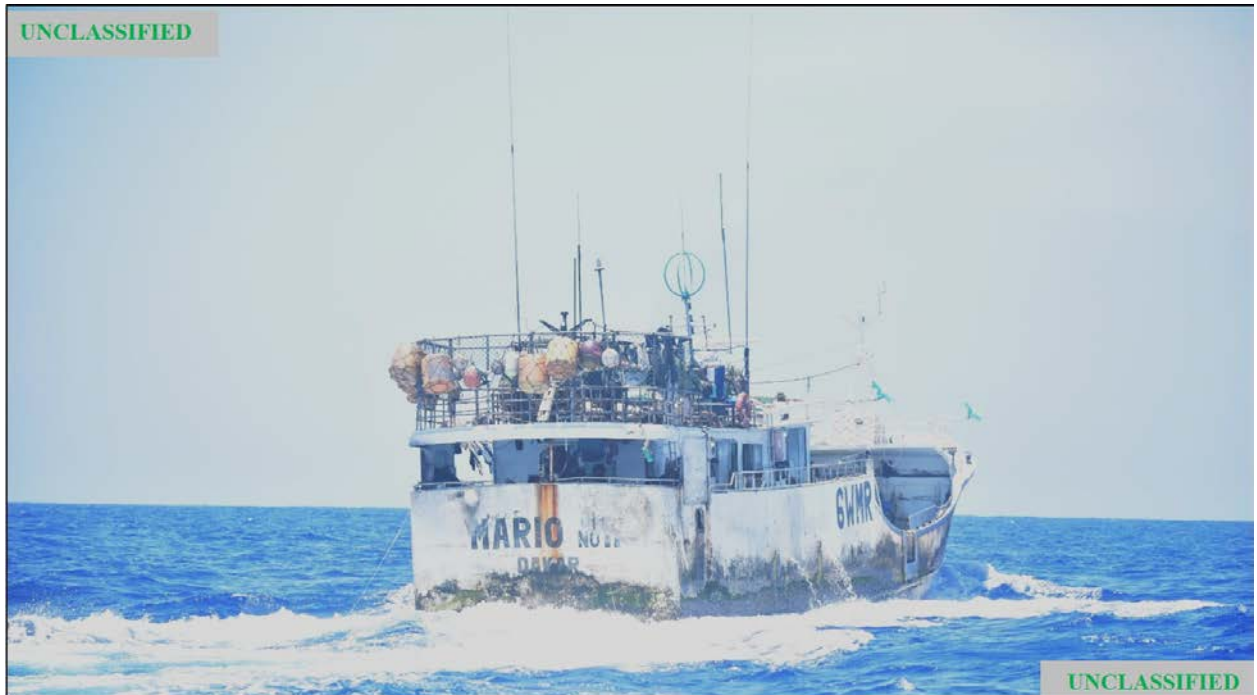
Figura (B). Fotografía tomada por la USCG del FV MARIO NO 11 durante la patrulla del 6 de mayo de 2020.