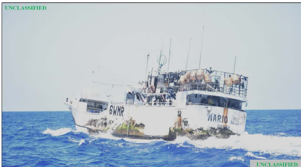
Figura (A). Localización del avistamiento por parte de la Guardia costera de Estados Unidos (USCG) del FV MARIO NO 11 durante la patrulla del 6 de mayo de 2020.