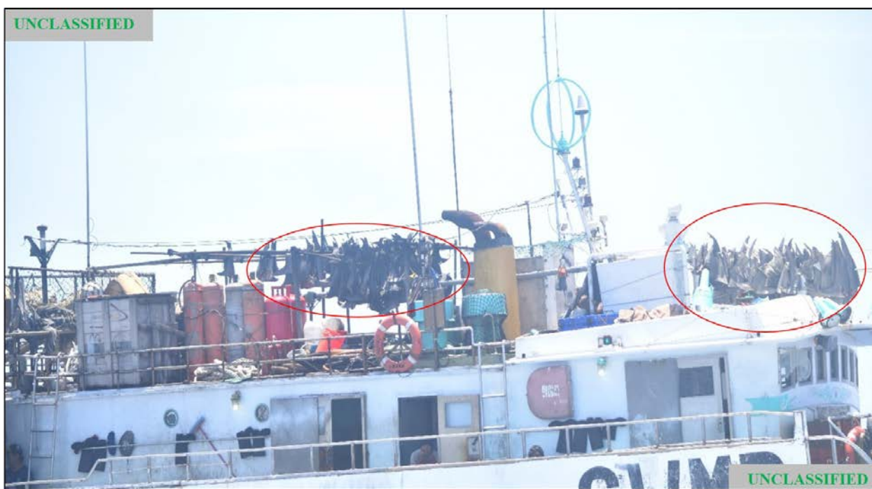
Figura (C). Fotografía tomada por la USCG del FV MARIO NO 11 durante la patrulla del 6 de mayo de 2020. El círculo rojo encuadra las aletas de tiburones que cuelgan por encima de la cubierta.