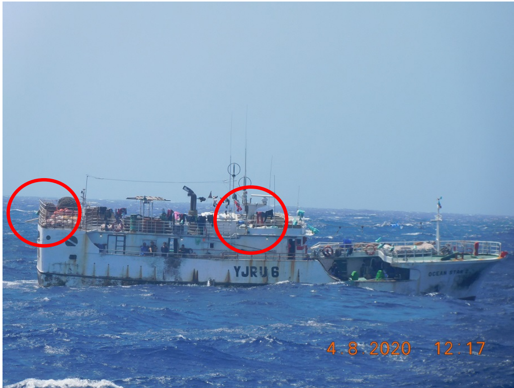
Figura (B). Fotografía de la Guardia costera de Estados Unidos del FV OCEAN STAR NO 2 durante la patrulla del 8 de abril de 2020. El círculo rojo resalta el arte de pesca de palangre observado en la cubierta del buque.