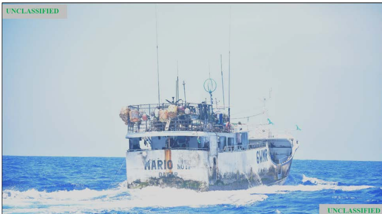
Figura (B). Fotografía tomada por la USCG del FV MARIO NO 11 durante la patrulla del 6 de mayo de 2020.