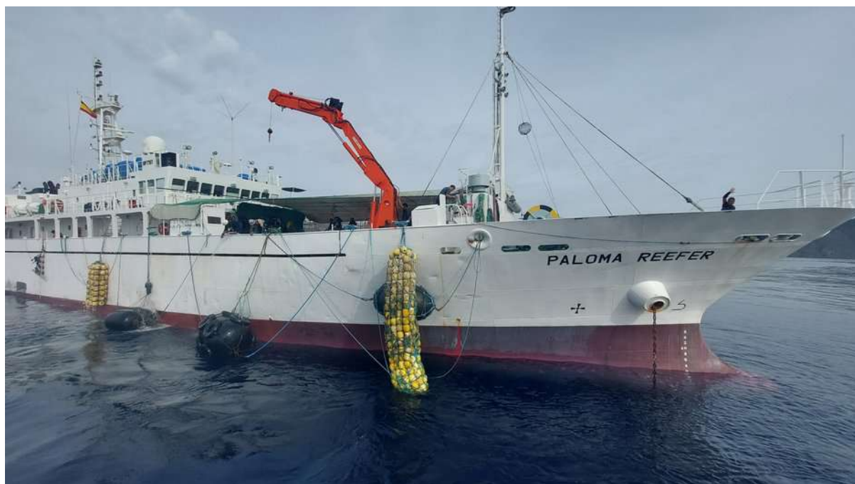
Fotografía 2: Buque congelador "Paloma Reefer", con la zona de trabajo en la proa del barco.

Tanto la toma de muestras, su procesamiento, conservación y etiquetado como la confección de la tabla de datos se elaboraron siguiendo los protocolos establecidos por ICCAT/GBYP.