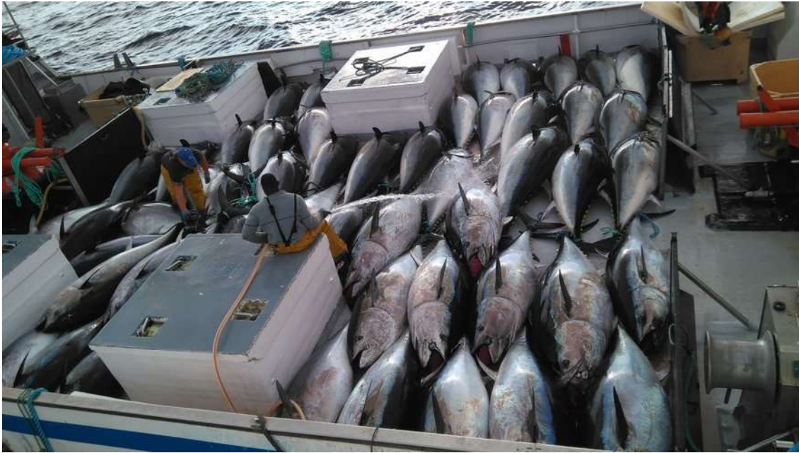
Fotografía 7: Llegada de un grupo de ejemplares recién sacrificados al buque congelador.

Como ya se ha comentado en apartados anteriores y al igual que en años previos, tenemos las dificultades derivadas de la inmediatez de la toma de decisiones que hacen que después de hacer el desplazamiento de personal, vehículo y la botadura de la embarcación se suspenda el muestreo.