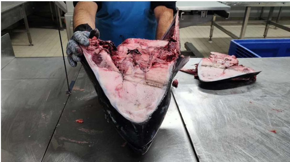
Fotografías 4 y 6: Trabajos de extracción de otolitos en instalaciones de Grupo Ricardo Fuentes e Hijos.