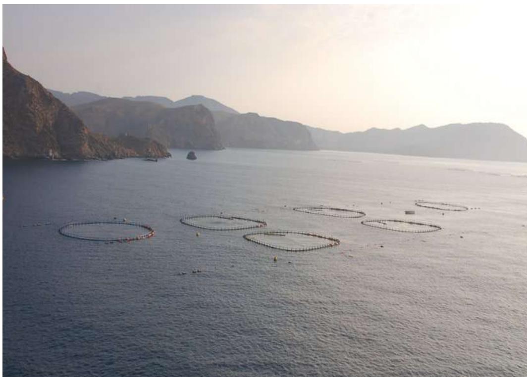
Fotografía 1: Polígono Acuícola El Gorguel, Cartagena, Murcia, SE de España.

El Polígono Acuícola de El Gorguel se encuentra frente a la pequeña cala del mismo nombre, entre la Bahía de Portman y el Cabo del Agua, T.M. de Cartagena, Murcia, SE de España. Se trata de una costa acantilada orientada al Sur y con pendientes acusadas y regímenes de corrientes bastante fuertes, entre otros motivos por su proximidad al Cabo de Palos.