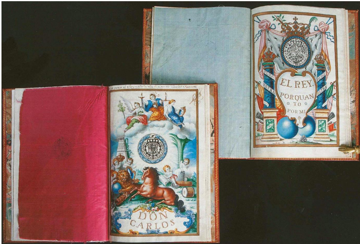
Figure 2. Front pages of the two illuminated royal licences y faculties provided by the King of Spain, Carlos III in 1789 (lower image) and 1790 (upper image) to the Earl of Lalaing for deploying and manage the tuna trap along the coast of Tortosa (Cataluña, España).